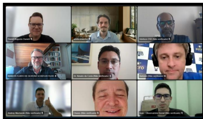
Reunião do Conselho Municipal de Inovação