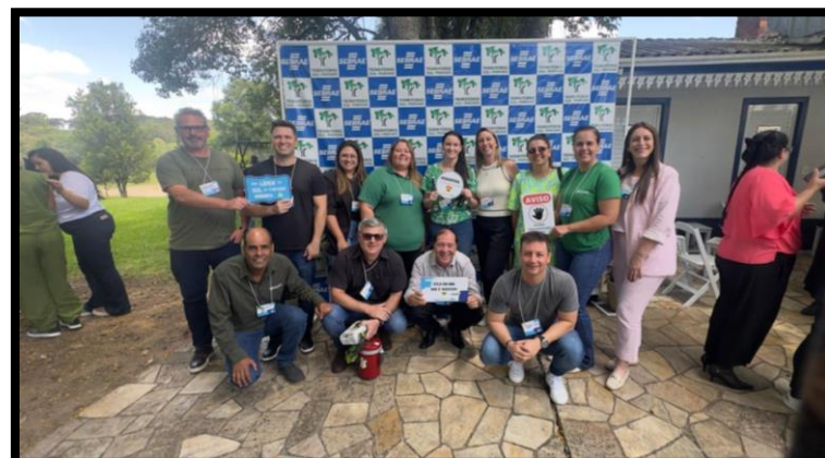
Reunião do Território Sul do Paraná