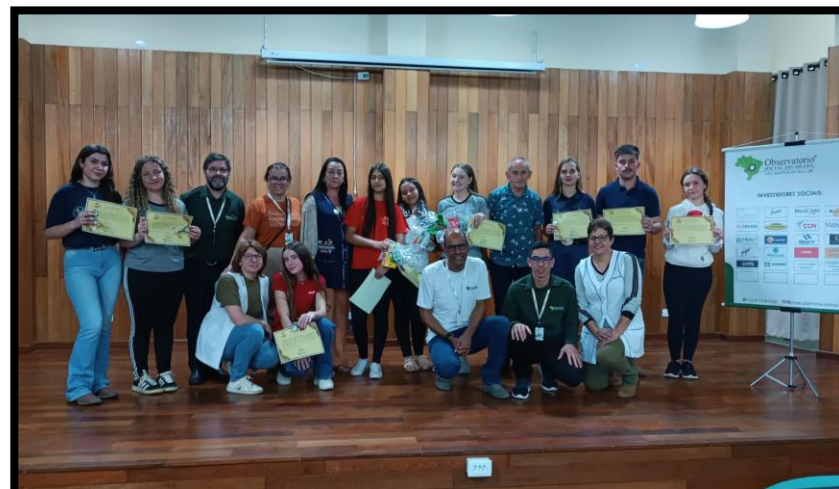
19 de novembro de 2025 - 2ª Edição – Colégio Eugênio de Almeida (Fluviópolis)