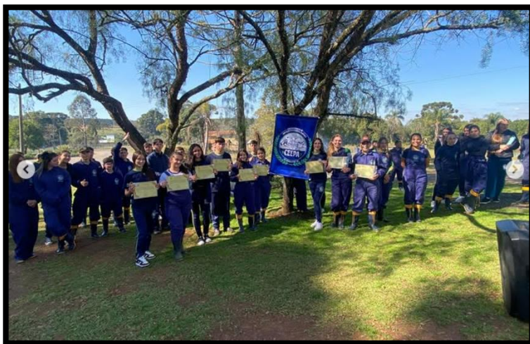
15 de agosto - 1ª Edição – CEEPA - Centro Estadual de Educação Profissional Agrícola (Colônia Taquaral)