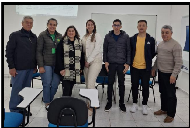
Reunião do Comitê Gestor Municipal