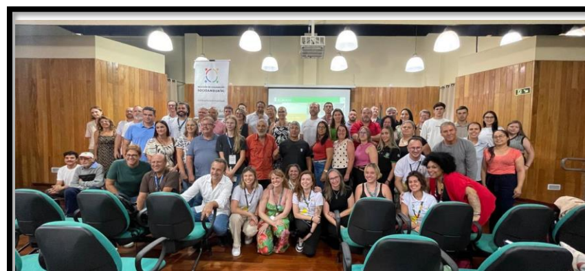
Núcleo de Cooperação Socioambiental – Sul do Paraná | Serra da Esperança